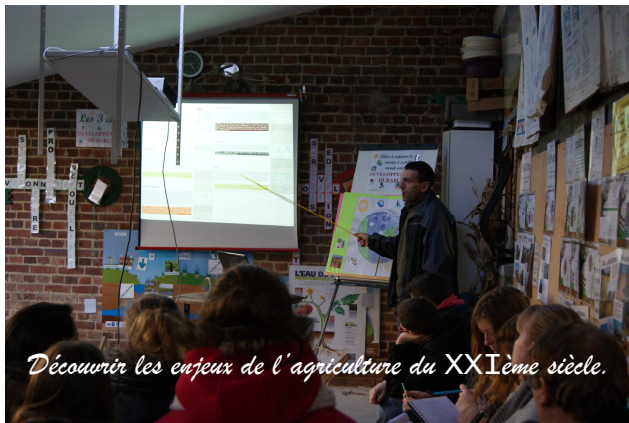
Découvrir les enjeux de l'agriculture du XXIème siècle.

Association « LE SAVOIR VERT » Cité de l'agriculture BP 136 62054 ST LAURENT BLANGY Tél: 03 21 60 57 20 Fax: 03 21 60 58 07 www.savoir-vert.asso.fr