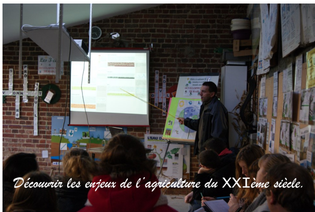
Découvrir les enjeux de l'agriculture du XXIème siècle.

Association « LE SAVOIR VERT » Cité de l'agriculture BP 136 62054 ST LAURENT BLANGY Tél: 03 21 60 57 20 Fax: 03 21 60 58 07 www.savoir-vert.asso.fr